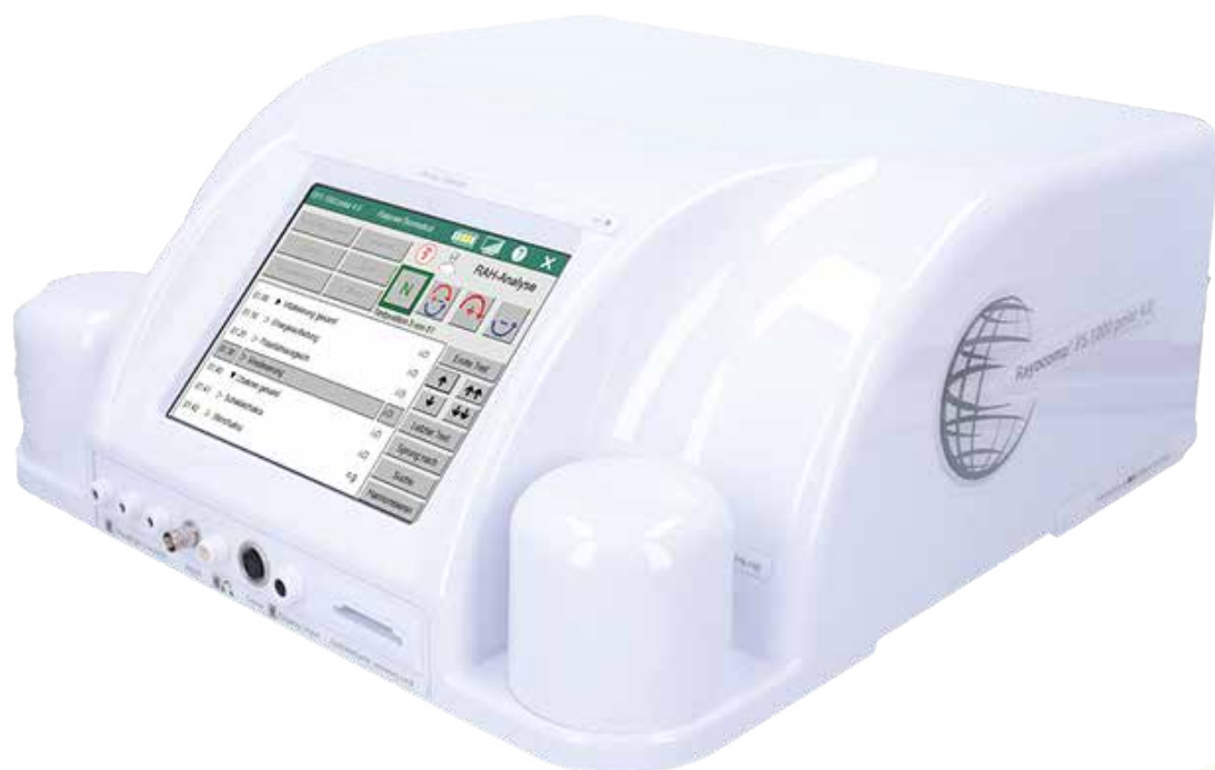
Rayocomp PS 1000 polar 4.0